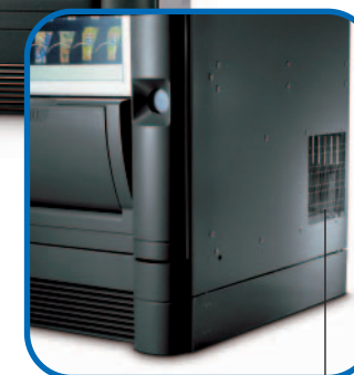
Varmluftsudgang på sidepanel