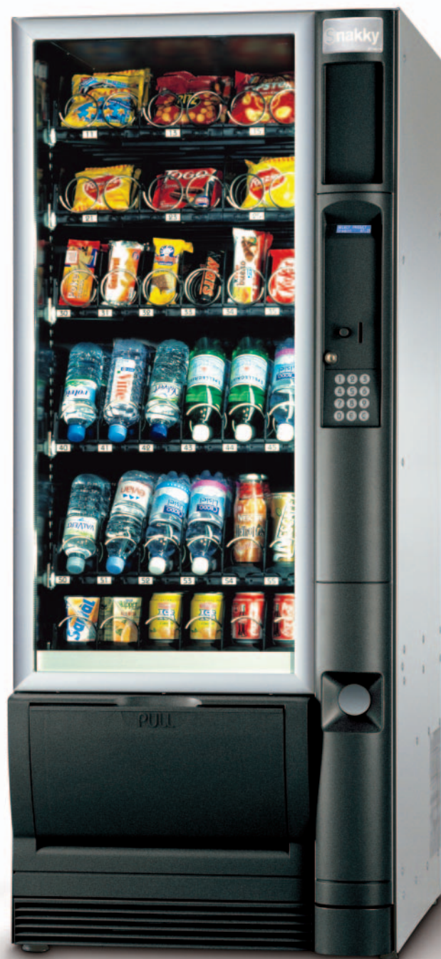
Eksempel på konfiguration