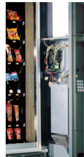
Separat enhed med uafhængig adgang til betalingssystem og elektronik

Snakky har et ergonomisk og vandalsikkert produktudleveringsrum (patenteret) med mulighed for blokering, når der ikke handles. Købte produkter er lette at tage op, og grundet en dæmper lukker det robuste udleveringsrum sig langsomt bagefter. Den nye skub-ind-/træk-ud-køleenhed kræver minimal vedligeholdelse og er nem at udtage. Betalingssystem og elektronik er placeret i en separat udtrækkelig enhed med uafhængig adgang, så automaten kan serviceres i dette område uden at temperaturen i produktområdet ændres.