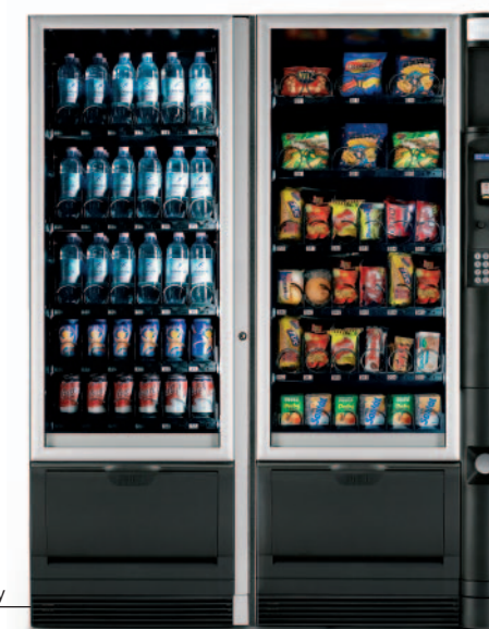
Snakky SL og Snakky

Hvis der er behov for en ekstra stor kapacitet kan Snakky placeres ved siden af en Snakky SL, som svarer til en Snakky men uden betalingssystem. V.h.a. et master/slave-kit deler de to automater betalingssystemet og valgpanelet, som er placeret på Snakkyen.